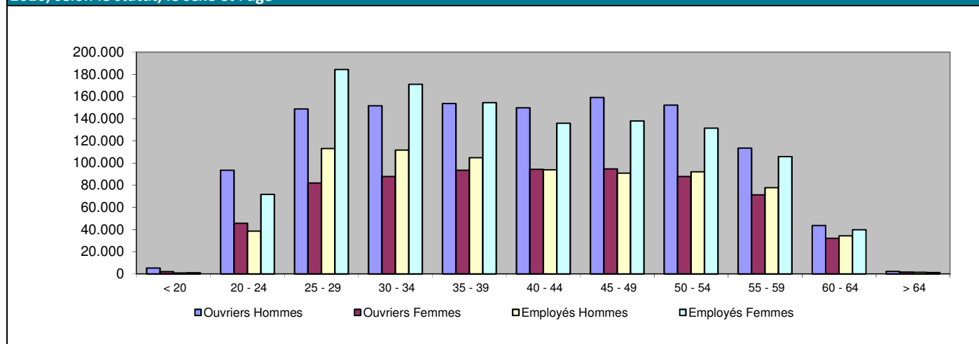
Graphique 2 - Nombre de travailleurs salariés et de chômeurs indemnisables dans le cadre de l'incapacité primaire au 31 décembre 2016, selon le statut, le sexe et l'âge